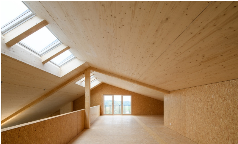
Ausgebauter Dachstuhl in Fichtenholz